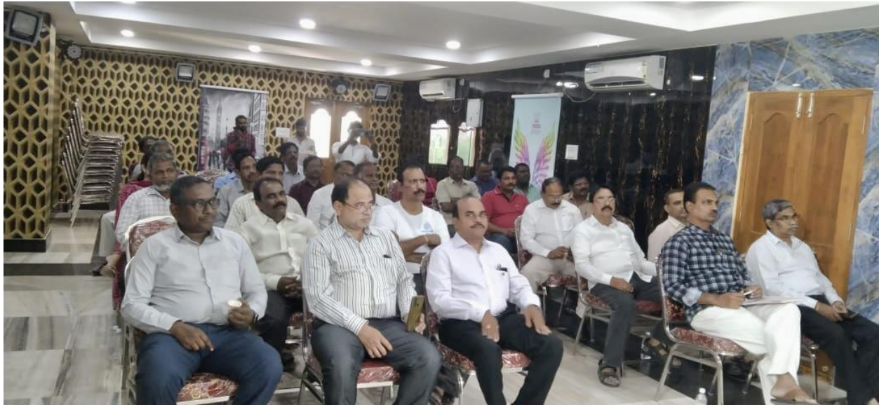
Rotary Members attended the Speaker Meeting held on 23.10.2022