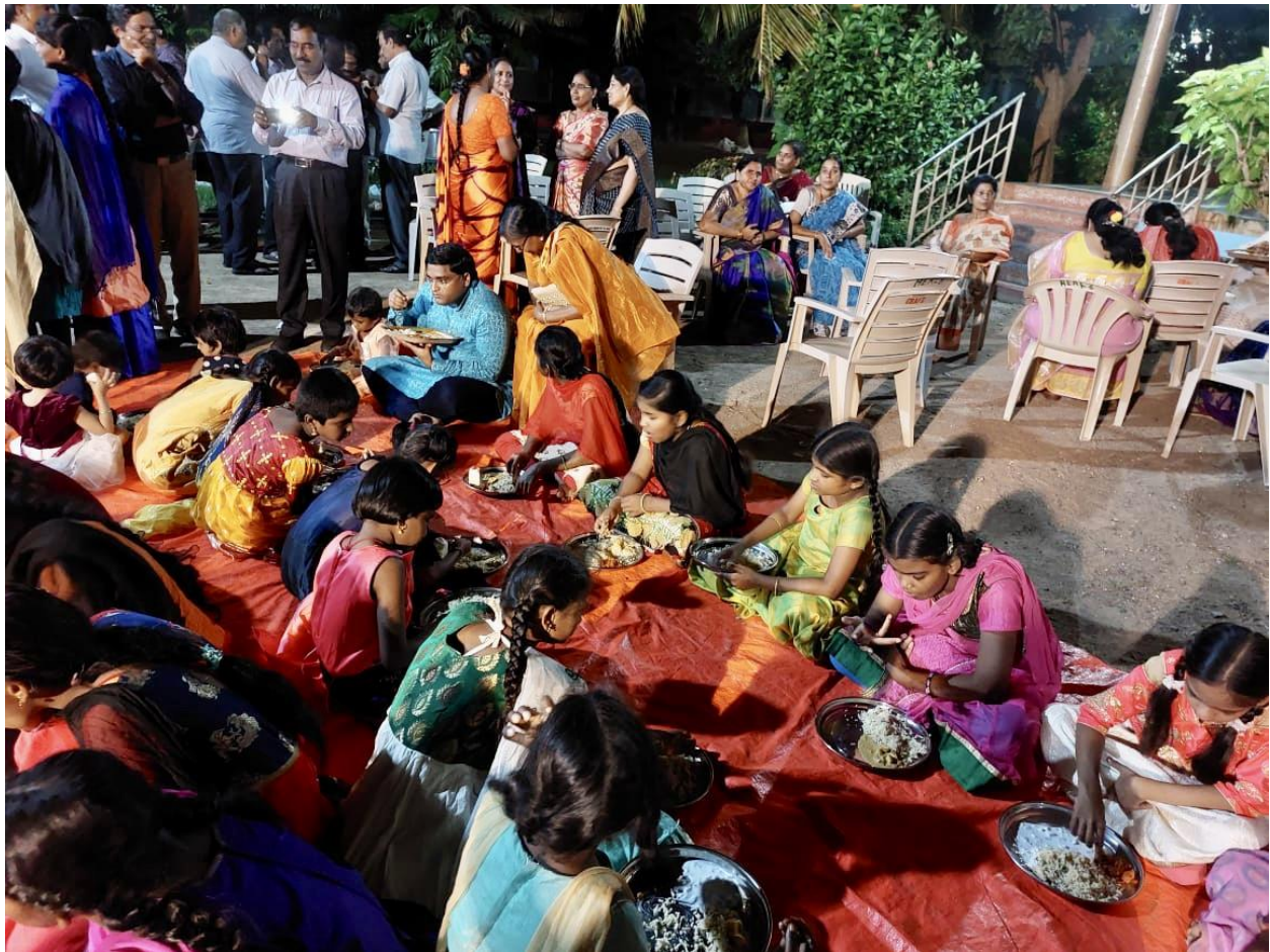
Pre Diwali celebrations at HEAL Children Village, Chowdavaram - Dinner arranged to HEAL Children on 23.10.2022