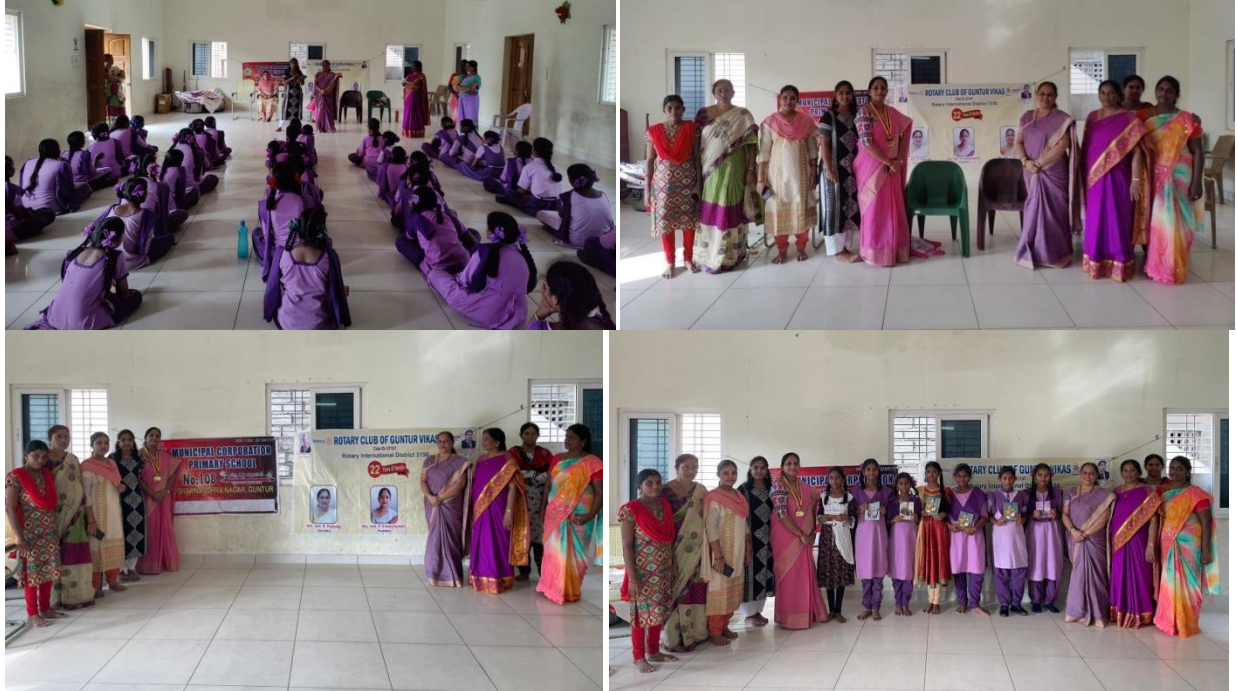
On 11.10.2022, our Club has conducted Awareness Programs to Girl Children, on "Menstrual Hygiene", & "Good Touch and Bad Touch", at Guntur Municipal Corporation High School, Swarnandhra Nagar, Guntur. It's District Designated Activity.