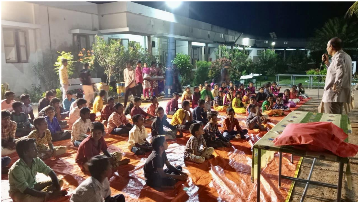
Pre Diwali celebrations at HEAL Children Village, Chowdavaram, on 23.08.22 - participants & guests