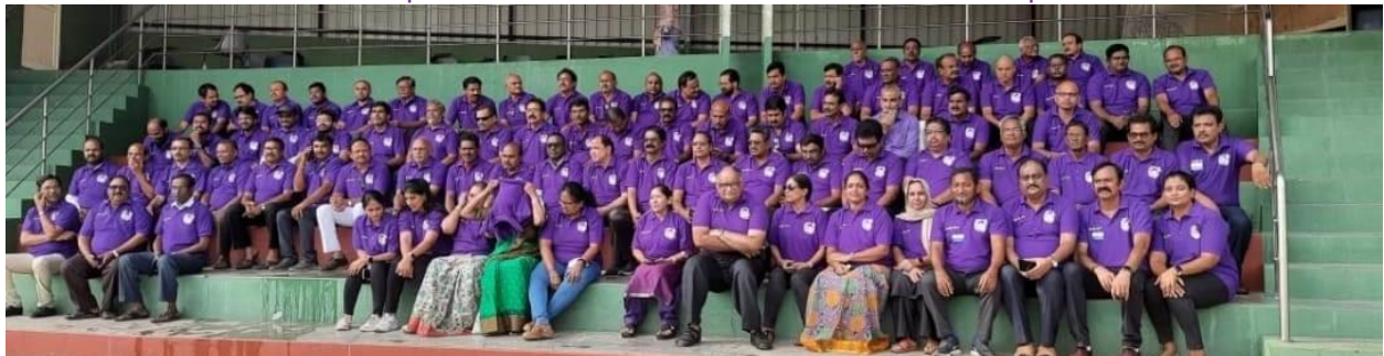
Total Rotary Family - that's going to work on "UTTEJAM" District Conference, at Guntur on 4th & 5th February, 2023