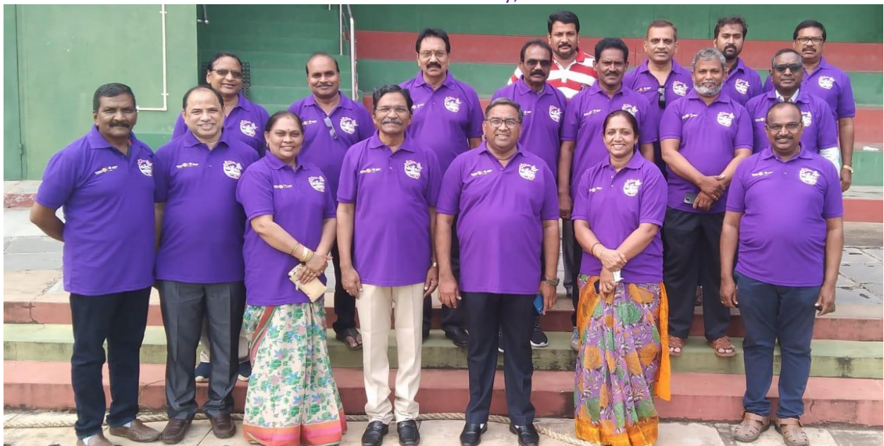
Our Club "Uttejam" Task force members with Dist. Governor Rtn.T.Rajasekhar Reddy